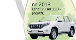
no 2013 Land Cruiser 150 - facelift.