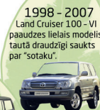
1998 - 2007 Land Cruiser 100 - VI paaudzes lielais modelis, tautā draudzīgi saukts par "sotaku".