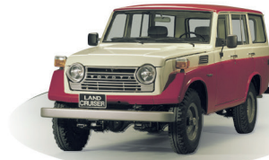
1990 - 1996 Land Cruiser 70 atjaunotais modelis, ieguvš papildvārdu - Prado, kurš turpmāk daudzus tirgos apzīmē šo Land Cruiser modeļu līniju. "Maza" Land Cruiser pirmā paaudze.